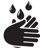
Hände regelmäßig waschen/desinfizieren