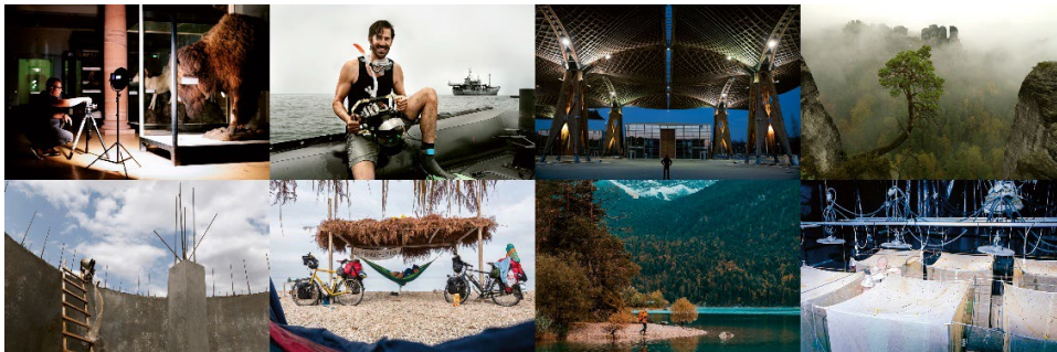
Während der Photographer Talks gewähren die Fotografen Einblicke in ihre Arbeit.