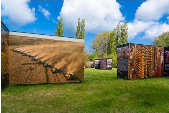
„Feed the Planet“ von George Steinmetz ist die größte Ausstellung des Festivals.