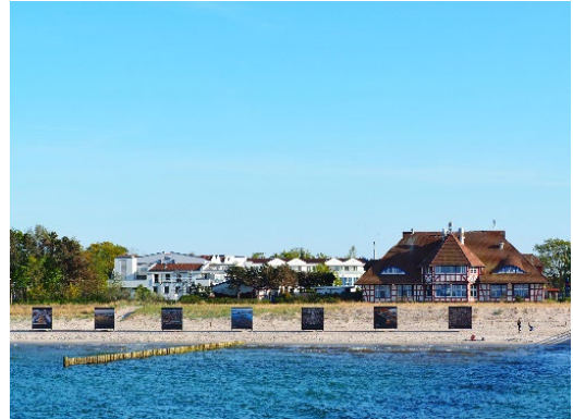
Die Strandausstellung zeigt „Die Ernte der Ozeane“ von George Steinmetz.